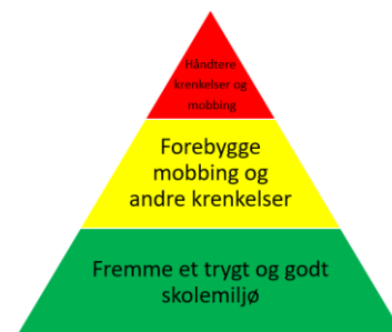
Figur 1 Helhetlig arbeid med skolemiljø (fra ny plan)

I den nye planen er det lagt til grunn at arbeid med å fremme et trygt og godt skolemiljø skal være kontinuerlig og systematisk. Skolen skal jobbe med å få positive relasjoner mellom voksen og elev og blant elevene og sikre at de voksne har evne til å lede elevene i skole og SFO. Elevene skal ha en aktiv rolle i det forebyggende arbeidet. Elevrådet skal få et eierforhold til skolens plan for et trygt og godt skolemiljø og delta i utforming av tiltak. FAU og SU/SMU skal orienteres om skolens plan for et trygt og godt skolemiljø og involveres i utforming av tiltak.