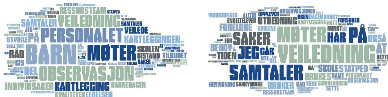
Figur 1 Gjøremål PP-rådgivere bruker tid på ute i barnehager og skoler. Alle svar til venstre og til høyre kun utdypende kommentarer.

Alle har krysset av for at de bruker tid på møter om individsaker, kartlegging av barn og observasjon av barn som del av kartleggingen, observasjon for å veilede personalet og annen råd og veiledning av personalet. Det var mulig å utdype svarene i en egen kommentar. Vi har laget to ordskyer nedenfor, den til venstre viser alle svar inklusiv de utdypende kommentarene. Møter er det gjøremålet som går mest igjen (altså som PP-rådgiverne oppgir at de bruker mest tid på), deretter observasjon og veiledning. Vi har også laget en ordsky av de utdypende kommentarene (til høyre). PP-rådgiverne har her kommentert mest rundt arbeidet de gjør med veiledning, deretter møter og samtaler.