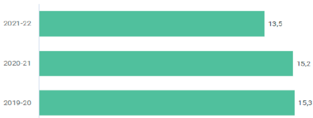
Nome kommune (EIER) | Lærertetthet i ordinær undervisning 1.-4. trinn | Egne tall

Kommunen understreker her at normen for lærertetthet er et minstekrav. Videre rapporterer kommunen tall for skoleårene 2021-2022, 2020-21 og 2019-20. Dette er vist i tabellene under.